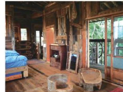
山の高台で豊かな緑に囲まれているため、大きな窓からの涼しい風が心地よい。ベランダからは絶景が望める